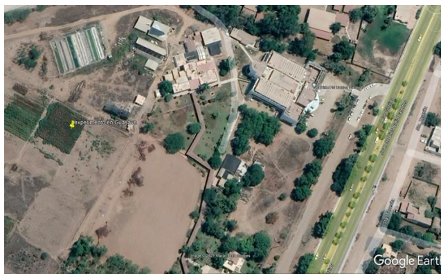
Figura 1. Ubicación del lote experimental de Ahome (Google maps, 2021).

El experimento 1, se estableció en el Municipio de Ahome, Sinaloa, México, ciclo agrícola Primavera-Verano 2020-2021, en un lote agrícola correspondiente a un productor cooperante, ubicado sobre la carretera Los Mochis-Ahome con coordenadas: Latitud: 25°54'32.06" norte, Longitud: 109° 9'8.02" (figura 1).