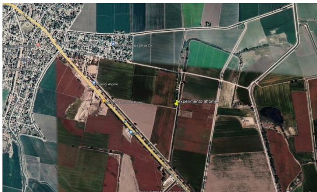
Figura 2. Ubicación del lote experimental de Guasave (Google maps, 2021).

El experimento 2, se realizó durante el ciclo agrícola Primavera-Verano 2020-2021 en el lote experimental de las Instalaciones del CIIDIR-IPN Unidad Sinaloa, con Dirección: Bulevar Juan de Dios Bátiz #250, Col. San Jochan, Guasave, Sinaloa, con coordenadas: Latitud: 25°32'49.27" norte, Longitud: 108°28'59.44" oeste (figura 2).